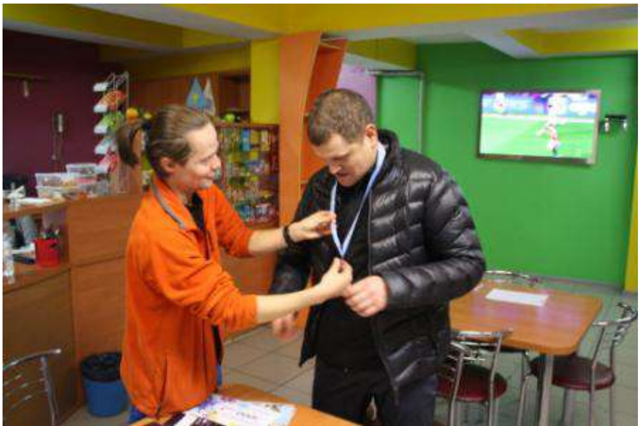
«Роман! Тебе это очень идёт!»