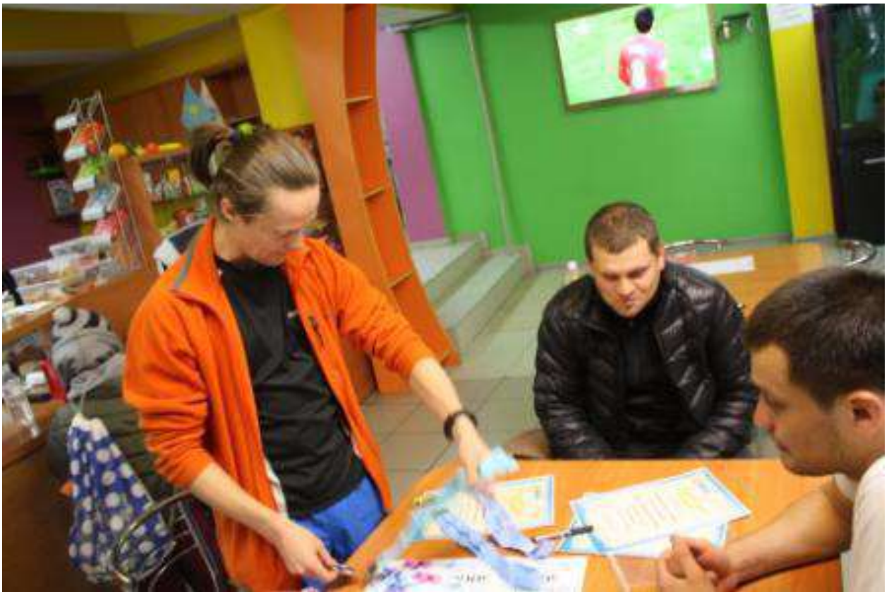
Продажа медалей главным судьёй по сходным ценам.